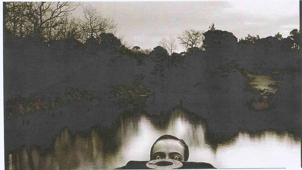
'La vista clavada', de la sèrie 'Els ulls aturats', de Manel Esclusa / MANEL ESCLUSA/GALERIA EUDE

ARA BARCELONA | ACTUALITZADA EL 07/06/2016 21:16