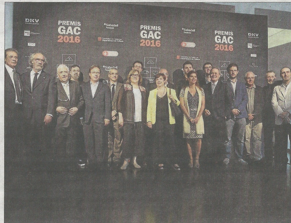
Foto de grup dels premiats en la Nit del Galerisme 2016