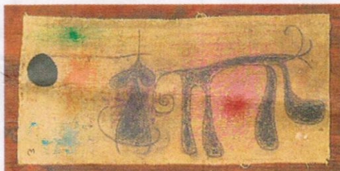
'FEMME ET CHEVAL', (1960), de Joan Miró.