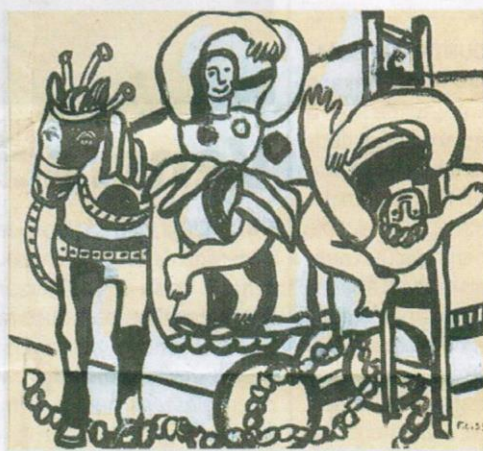
'LE TRAPÉZISTE ET L'ECUYÈRE', (1953), de Fernand Léger.